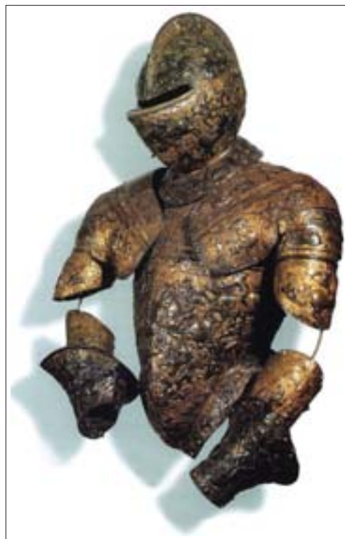
3. Zbroja paradna, trybowana, (Mediolan ?), 3 ćw. XVI w.