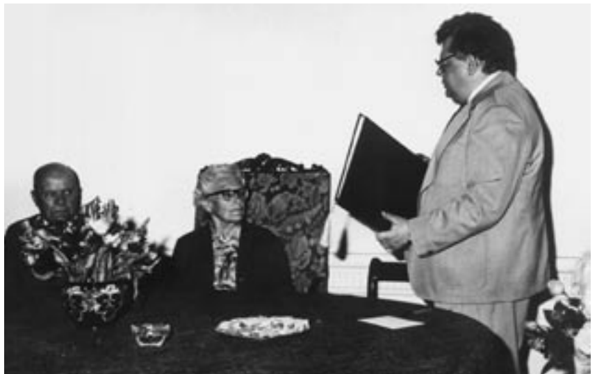
Stowarzyszenie Historyków Sztuki, 1979 r.