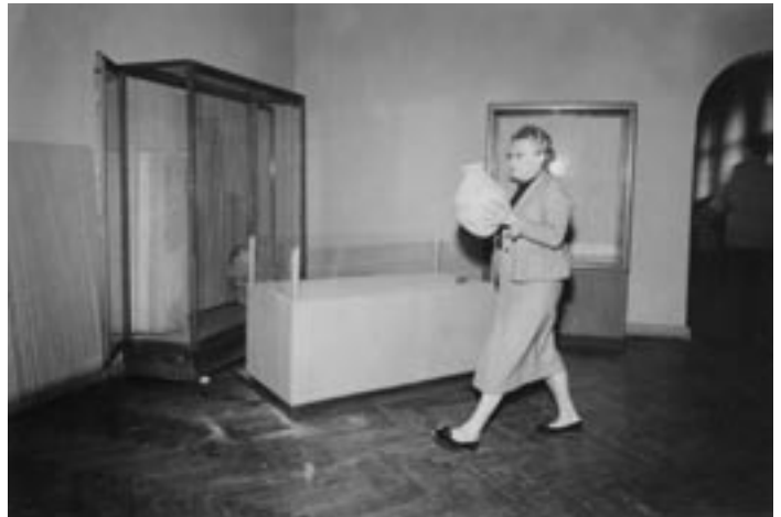
Muzeum Śląskie we Wrocławiu, 1962 r.