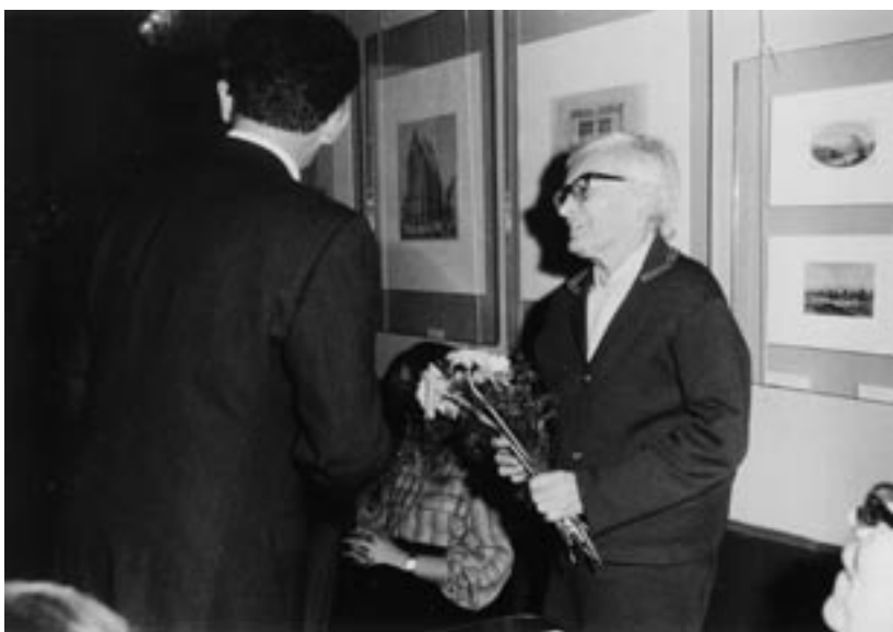
Stowarzyszenie Historyków Sztuki, 1985 r.