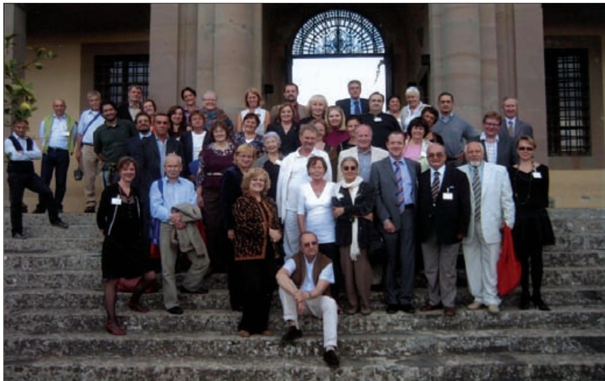
1. Uczestnicy Zgromadzenia Dorocznego ICLM przed Casa Caruso w Bellosguardo

Z Florencji pojechaliśmy przez punkt widokowy – Piazza Michelangelo – na południowy-zachód do pięknie na wzgórzach położonej miejscowości Lastra