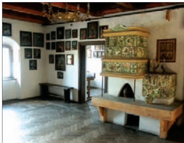
7. Folk Art Gallery – the Norbert Lippóczy collection

brak danych o twórcach albo podań czy legend z nimi związanych. Zasadniczo można podzielić te obrazy na dwie główne grupy: do pierwszej zaliczamy obrazy powstałe pod wpływem zachodniego malarstwa kościelnego, zaś drugą tworzą, malowane na szkle ikony ludowe, pochodzące z terenów wschodnich. Wykonali je ludowi malarze pod wpływem prawzorów sztuki cerkiewnej o podłożu bizantyńskim.