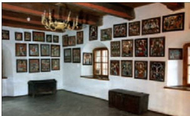
7. Galeria Sztuki Ludowej – kolekcja Norberta Lippóczy’ego