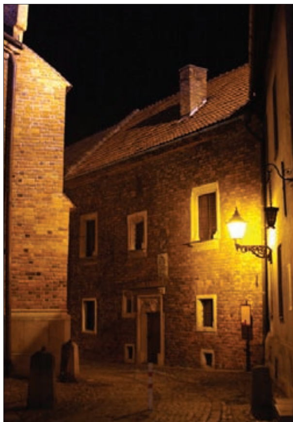
1. „Houses behind the Cathedral”: the Scholasteria, the Akademiola, the Mikołajewski House