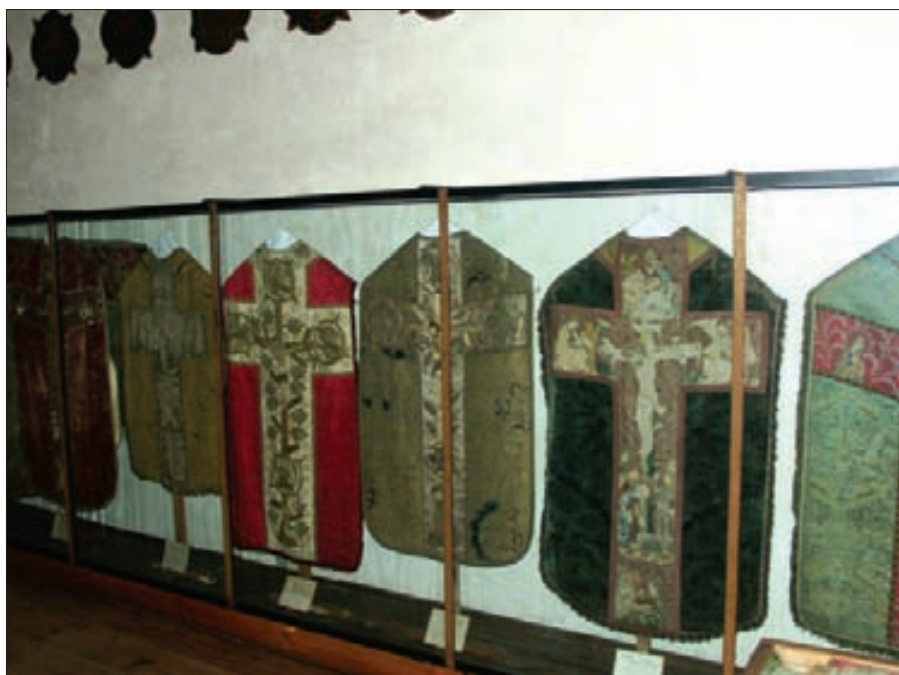
6. Galeria Tkanin

Na pierwszy rzut oka sale wystawowe tarnowskiej Scholasterii wydają się być obwieszane podobnymi zupełnie malowidłami – tak bowiem przemawiają do widza te jednakowo lśniące tafle szkła kolorowe i wzorzyste dzieła. Wnikliwe jednak wpatrywanie się pozwala dostrzec różnice i podobieństwa, zauważyć wpływy różnych tendencji artystycznych, pozwala zestawiać obrazy w grupy, klasyfikować je i nazywać. Jest to praca niełatwa, gdy często brakuje danych o historii obiektu, o jego pochodzeniu i miejscu powstania, gdy