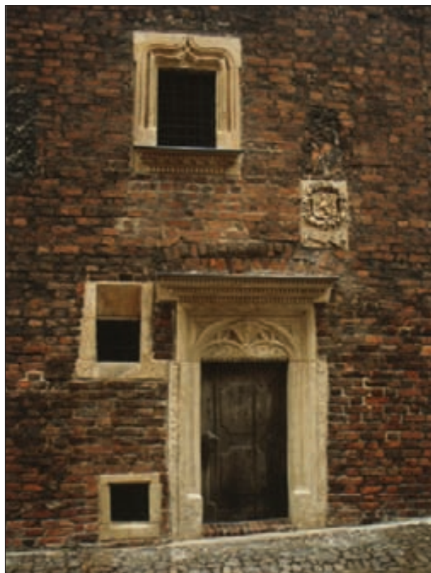
3. Dom Mikołajowski 1524

2. Shrine of St. Joseph, the Scholasteria