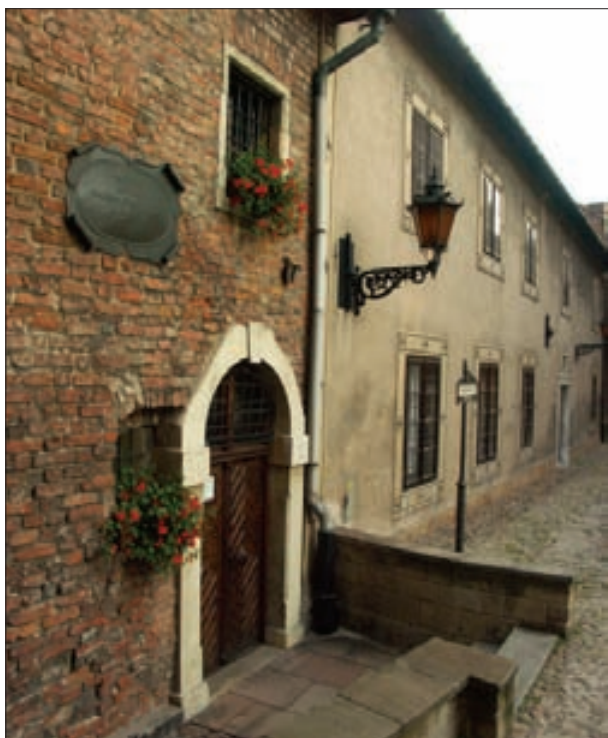
1. „Domy za Katedrą”: Scholasteria, Akademiola, Dom Mikołajewski

Muzeum Diecezjalne w Tarnowie 3 to najstarsze muzeum diecezjalne w Polsce. Założone w roku 1888 przez ówczesnego rektora Seminarium Duchownego, ks. Józefa Bąbę, mieściło się w budynku seminarium, w okresie międzywojennym w ratuszu miejskim, zaś obecnie znalazło siedzibę w zabytkowych kamie-