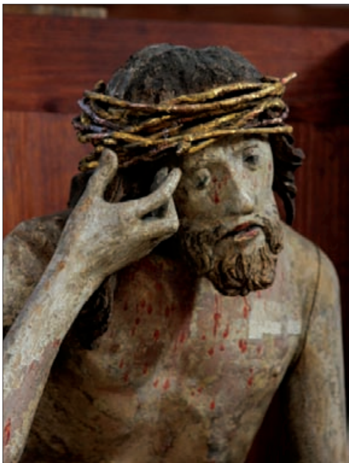
5. Chrystus Frasobliwy , pocz. XVI w, warsztat Wita Stwosza