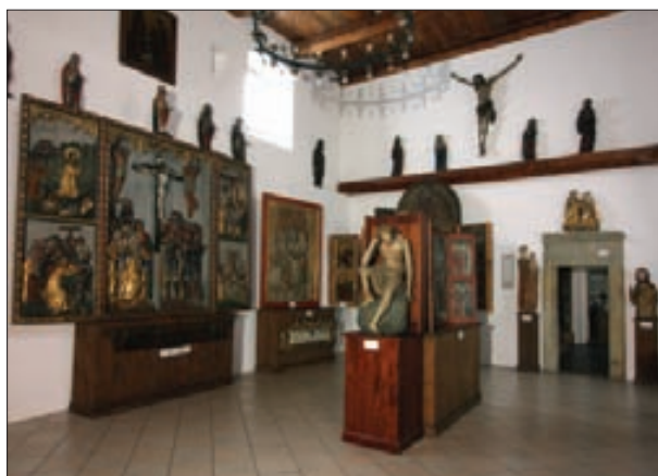
4. Galeria Sztuki Średniowiecznej