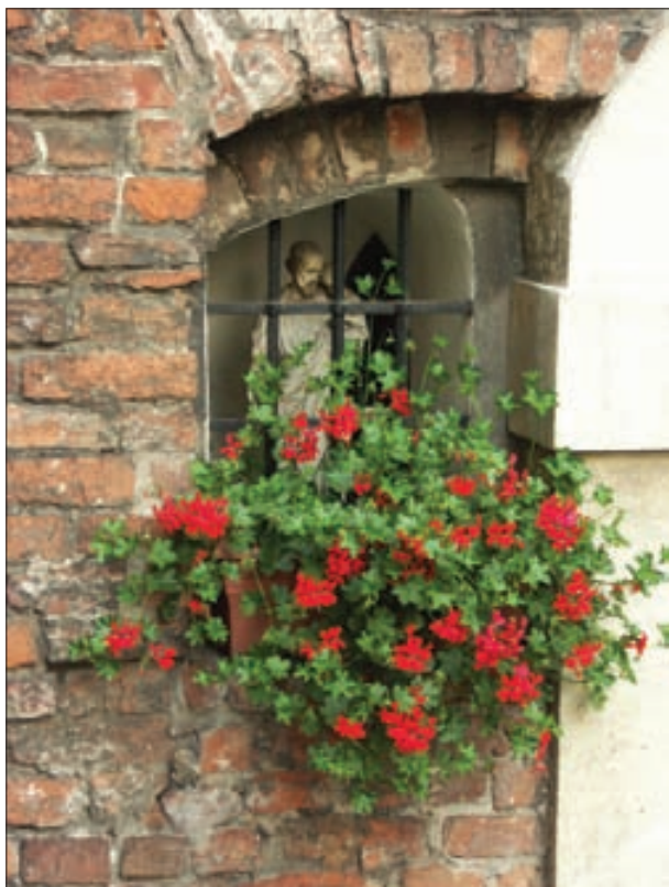
2. Kapliczka św. Józefa, Scholasteria

2. Shrine of St. Joseph, the Scholasteria