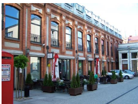
Zespół Starej Przędzalni w Żyrardowie, laureat konkursu ZZ 2013