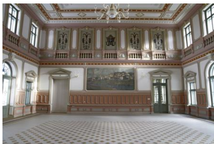
Dworzec Kolejowy w Przemyślu, wyróżniony w konkursie ZZ 2012

Czas na kolejną odsłonę konkursu Zabytek Zadbane . Konkurs skierowany jest do właścicieli, posiadaczy i zarządców obiektów wpisanych do rejestru zabytków.