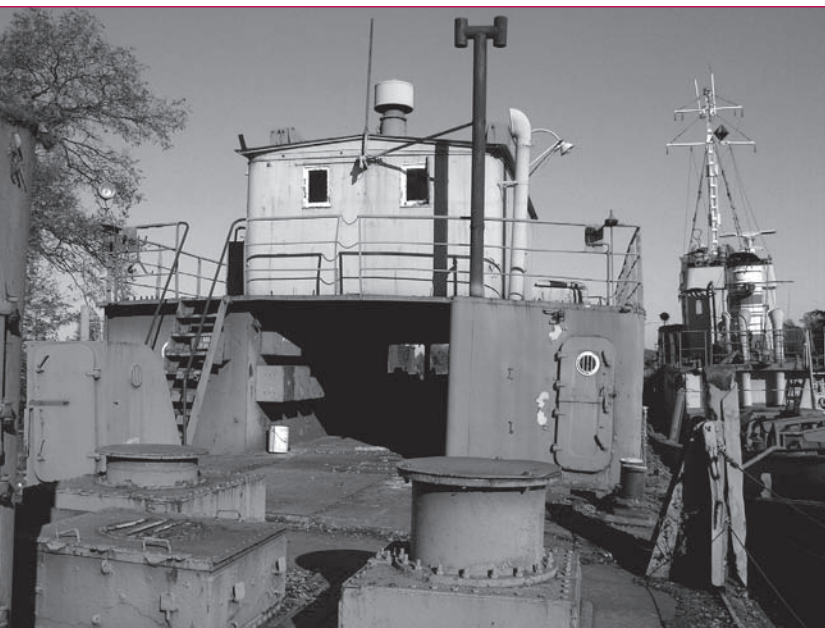
2. Pogłębiarka „Mamut”, część rufowa pokładu, 2005 r.

i maszynownia. W kotłowni znajdowały się m.in. dwa kotły cylindryczne, dwupłomienicowe typu szkockiego, wybudowane w 1954 r. przez firmę niemiecką Wilke Werke A.G. Braunschweig. Początkowo opalane węglem, na początku lat 60. przystosowane zostały do opalania mazutem. Maszynownia wyposażona była w oryginalną maszynę parową główną o mocy 600 KM. Służyła ona do napędu pompy piaskowej odśrodkowej o wydajności 400 m 3 /h, przeznaczonej do przetaczania urobku, sprzężonej ze skrzynią do osadzania kamieni. Pompa odśrodkowa do mułu (płuczka), o wydajności 250 m 3 /h, służyła do nawadniania urobku. Z czasów budowy pogłębiarki pochodziła ponadto maszyna parowa z pompą odśrodkową cyrkulacyjną, o wydajności 380 m 3 /h.