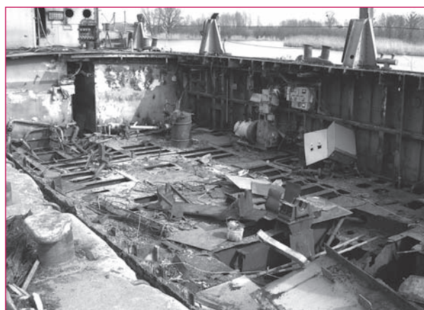
5. Pogłębiarka „Mamut”, stan po zniszczeniu, wewnątrz, 04.2006 r.

W tej sytuacji WKZ ponownie zawiadomił prokuraturę o podejrzeniu popełnienia przestępstwa, tym razem polegającego na zniszczeniu obiektu, wobec którego toczy się postępowanie o wpisanie do rejestru zabytków. Wobec całkowitej dewaloryzacji tego obiektu WKZ zmuszony był w czerwcu 2006 r. wydać decyzję o umorzeniu postępowania w sprawie wpisania do rejestru zabytków. Tymczasem postanowieniem z dnia 13 września 2006 r. Prokuratura Rejonowa Szczecin-Śródmieście umorzyła śledztwo w obu sprawach. W sprawie o sfalszowanie dokumentu stwierdzono „brak danych dostatecznie stwierdzających podejrzenie popełnienia czynu zabronionego” i to mimo istnienia dowodu w postaci wspomnianego fałszyfikatu, którym posługiwał się podejrzany. W sprawie o zniszczenie zabytku nie dopatrzono się „znamion czynu zabronionego”. W odpowiedzi Wojewódzki Konserwator Zabytków złożył zażalenie na postanowienie prokuratury. Po ośmiu miesiącach wydała ona kolejne postanowienie – tym razem o zawie-