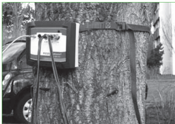
3. Tomografia impedancji elektrycznej – PiCUS Treetric.

nikiem pomiaru jest dwuwymiarowa mapa impedancji elektrycznej przekroju poprzecznego pnia, gdzie każdy kolor odpowiada określonej wartości oporu elektrycznego (impedancji).