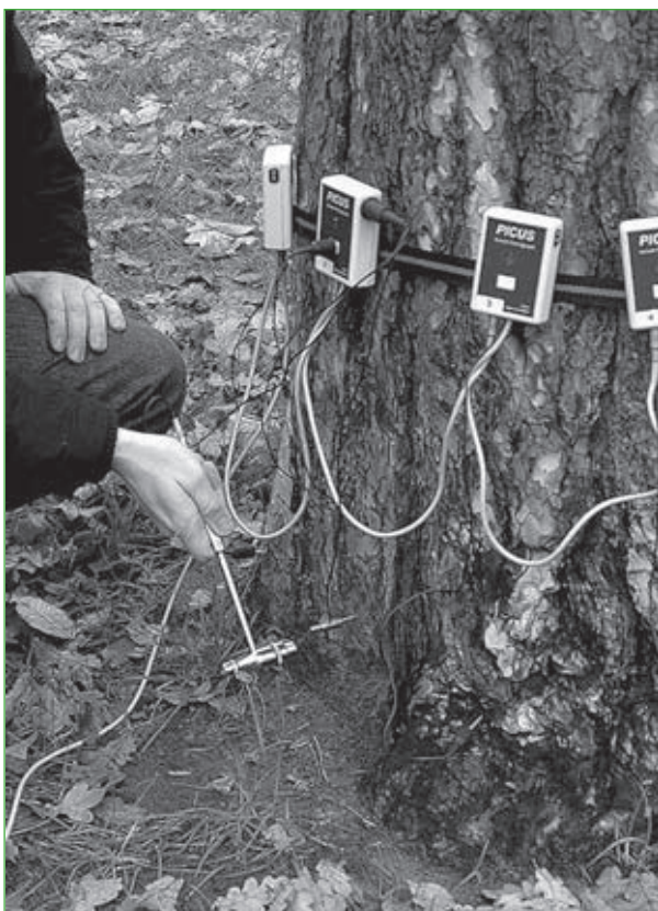
1. Przebieg diagnozy akustycznej przywodzi na myśl pracę dzięcioła.