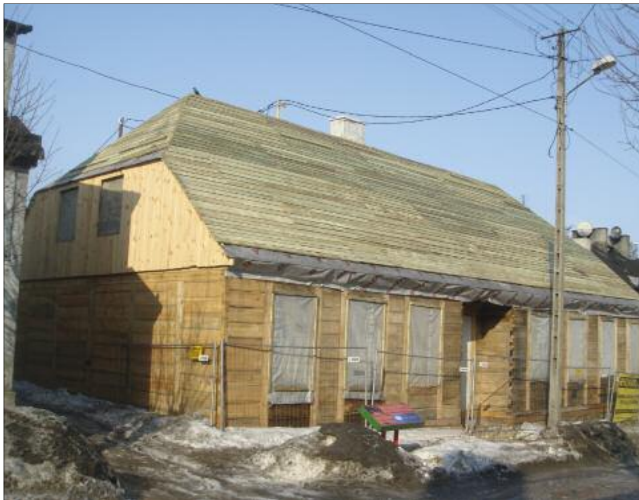
7. Dom przy ul. Narutowicza 6, prace konserwatorskie, luty 2010 r. 7. House in 6 Narutowicza Street, conservation work, February 2010.

na tym terenie, w której właścicielem ponad 50 proc. nieruchomości było miasto, przemawiała na korzyść realizatorów programu, zaś od determinacji samych wykonawców zależało prawidłowe i skuteczne wykorzystanie przysługujących im odpowiednich instrumentów prawnych.