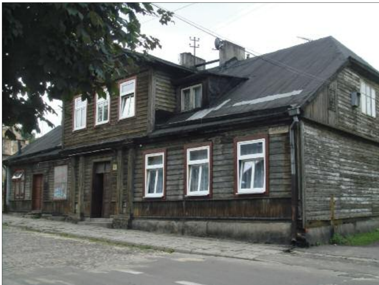
1. Dom przy ul. Narutowicza 4, sierpień 2009 r. 1. House in 4 Narutowicza Street, August 2009.