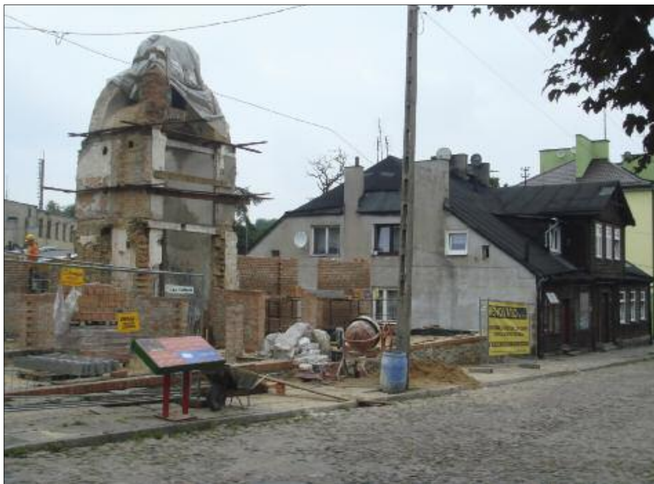
6. Dom przy ul. Narutowicza 6, prace konserwatorskie, sierpień 2009 r. 6. House in 6 Narutowicza Street, conservation work, August 2009.

Autorzy programu uznali, iż dla skutecznej ochrony dziedzictwa kulturowego Zgierza konieczna może okazać się zmiana stosunków społecznych w rewitalizowanym obszarze, polegająca m.in. na przeniesieniu przynajmniej części lokatorów mieszkań komunalnych znajdujących się w zabytkowych budynkach do innych lokali 12 . Jest to najbardziej kontrowersyjny punkt większości programów rewitalizacyjnych, rodzący najwięcej konfliktów, a często decydujący o niepowodzeniu całego przedsięwzięcia. W analizowanym przypadku struktura własnościowa