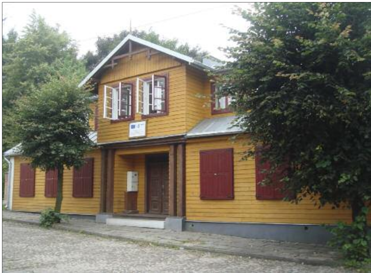
10. Dom tkacza przy ul. Narutowicza 12 po remoncie konserwatorskim przeprowadzonym w 2007 r. z funduszy Zintegrowanego Programu Operacyjnego Rozwoju Regionalnego, sierpień 2009 r.

10. Weaver's house in 12 Narutowicza Street after conservation conducted in 2007 thanks to funds provided by the Integrated Operational Regional Development Programme, August 2009.