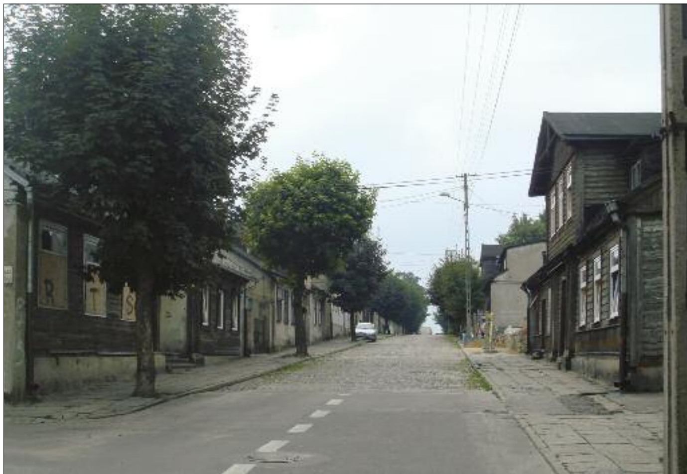
4. Ulica Narutowicza, widok od strony ul. Rembowskiego, sierpień 2009 r.