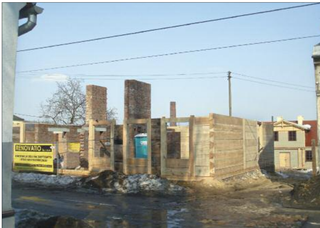
9. Ulica Rembowskiego, prace przy translokacji dwóch domów tkaczy z ul. Dąbrowskiego 7 i 9, w głębi widoczny dom przy ul. Rembowskiego 1 przeniesiony z ul. Dubois 7, luty 2010 r.

wytyczne i wnioski do miejscowego planu zagospodarowania przestrzennego dla samego parku, do opracowywania którego przystąpiono już w 2004 r., zgodnie z uchwałą Rady Miasta 21 . Do tej pory miejscowy plan zagospodarowania przestrzennego nie ma jednak mocy prawnej, co stwarza bardzo trudne warunki działania dla twórców parku. Jak już wskazano na wstępie, do chwili uprawomocnienia się planu wstrzymaniu ulegają postępowania o wydanie decyzji o warunkach zabudowy na danym terenie, w tym wypadku na terenie parku kulturowego. W konsekwencji projekty budowy zastępczych budynków dla mieszkańców drewnianych obiektów, które poddawane są rewitalizacji, pozostać muszą w zawieszeniu do czasu uchwalenia planu zagospodarowania, uniemożliwiając tym samym zmianę sposobu wykorzystania wartościowych budynków zamieszkałych aktualnie przez lokatorów komunalnych i ograniczając działania rewitalizacyjne jedynie do obiektów niezamieszkałych.