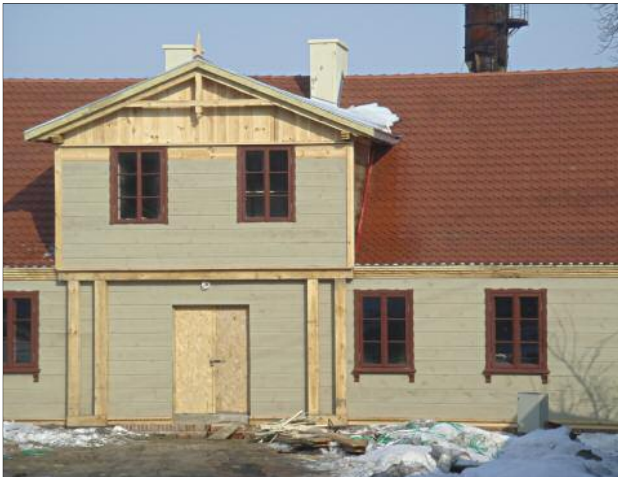
8. Dom tkacza przeniesiony z ul. Dubois 7 na ul. Rembowskiego 1 i pokryty dachówką, luty 2010 r.