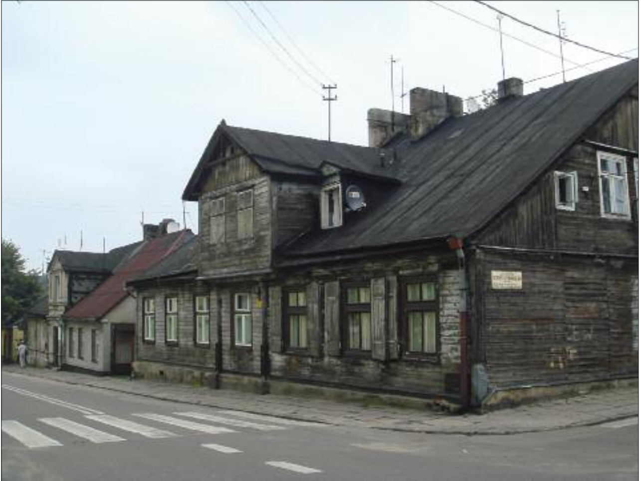
3. Dom przy ul. Narutowicza 5, róg ul. Rembowskiego, sierpień 2009 r. 3. House in 5 Narutowicza Street, corner of Rembowskiego Street, August 2009.

Nowego Miasta. Jej plan oparty został na symetrycznej ukształtowanej siatce ulic, której osią stała się ulica Długa, łącząca rynki Starego i Nowego Miasta. Ten ostatni – centrum Nowej Osady – wytyczony na planie kwadratu o wymiarach 100x100 m, znajdował się na przecięciu dwóch ulic: Długiej i Wysokiej, do których równolegle lub prostopadłe poprowadzono pozostałe ulice (z dwoma wyjątkami). Tak racjonalnie zaplanowana dzielnica drewnianych domów i warsztatów sukienników stała się przykładem dla innych ośrodków włókiennictwa w okręgu łódzkim.