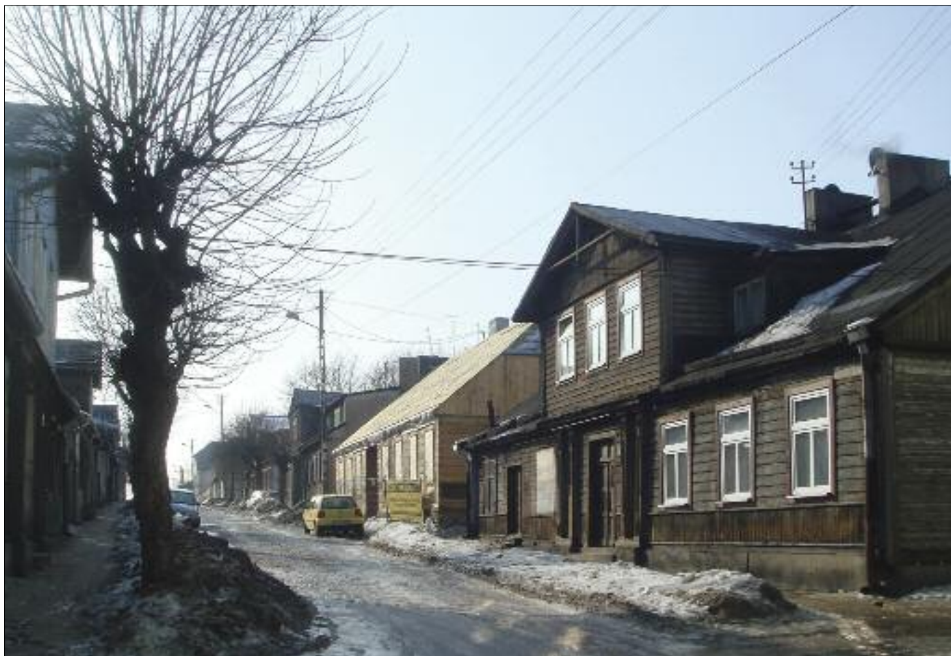
5. Ulica Narutowicza, widok od strony ul. Rembowskiego, po prawej stronie w głębi widoczny złożony po pracach konserwatorskich dom tkacza przy ul. Narutowicza 6, luty 2010 r.